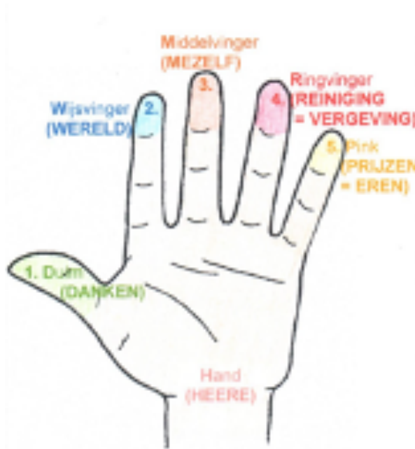
De hand van het gebed